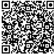
Escanea para acceso rápido