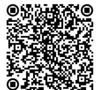
Escanea para acceso rápido